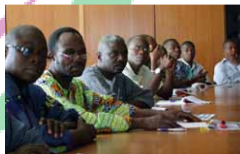
Réunion Noria à l'Assemblée nationale du Togo

Du 17 au 22 décembre 2012, le programme Noria a procédé à la clôture de son aide à l'Assemblée nationale du Togo. Depuis son lancement après le Bureau de New York en 2009, le programme a contribué à la structuration du réseau, à l'équipement et aux formations pour la consolidation des compétences du personnel parlementaire togolais, en particulier à travers le travail collaboratif en réseau et la création du nouveau site internet. Il a également acquis et installé une quarantaine de microphones pour faciliter les interventions des députés pendant la séance.