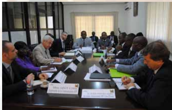
Réunion de travail avec les représentants du Programme des Nations Unies pour le Développement (PNUD) et d'USAID

L'état de délabrement de cette salle, où repose l'essentiel de la mémoire historique et parlementaire de l'Assemblée nationale ivoirienne, a fortement touché