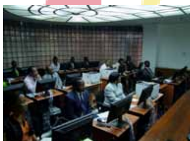
Salle informatique de l'Assemblée nationale du Gabon

Après la prolongation d'un an à la demande des Présidents de l'Assemblée nationale et du Sénat, l'appui à la modernisation des systèmes d'information auprès du Parlement du Gabon est arrivé à son terme. Ainsi, une mission de finalisation du programme auprès de deux Chambres s'est déroulée du 5 au 11 décembre 2012.