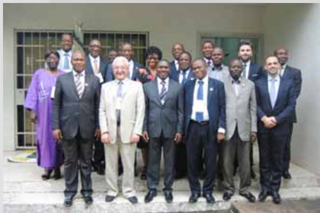
La délégation de l'APF a rencontré les membres de la section ivoirienne et les autorités administratives de l'Assemblée nationale

Réintégré lors de la XXXVIII e Session de l'APF en juillet 2012, la section de Côte d'Ivoire avait, par la voix de son président, Guillaume Kigbafori Soro, émis le souhait de devenir un « bastion de la démocratie, de l'intégration africaine et de la coopération interparlementaire ». Quelques mois plus tard, en décembre 2012, l'APF s'est rendue à Abidjan pour envisager, avec les autorités parlementaires ivoiriennes, les bases d'un nouveau programme de coopération.